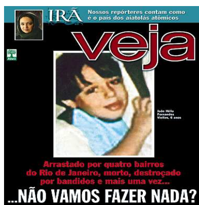
Capa Revista Veja , 14/02/2007

“Na base do governo, PT, PTB e PSB ficaram unidos na rejeição da proposta, mas o PMDB votou majoritariamente a favor, com exceção do líder do governo, Romero Jucá (RR), e de Pedro Simon (RS). Jefferson Peres (PDT-AM), que agora faz parte da coalizão, também votou contra o governo. ‘Repilo veementemente essa história de culpa coletiva, de que o menor virou um monstinho por culpa da desigualdade social. Quero que menores que cometeram crimes graves e forem avaliados como irrecuperáveis sejam segregados da sociedade’, disse Jefferson Peres. Já a oposição votou em bloco a favor da emenda, menos Lúcia Vânia (PSDB-GO).”